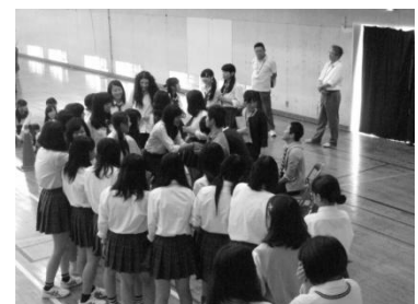
セクシャルマイノリティ の友達を囲む様子