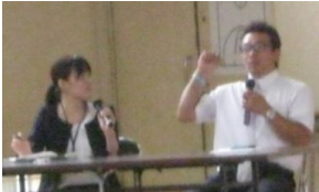
川崎さんと対話形式で 実施している様子